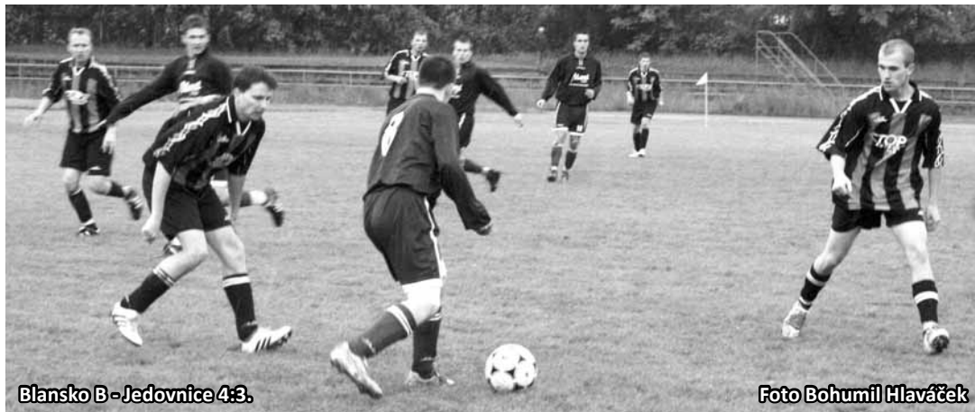
Blansko B – Jedovnice 4:3.

Hosté Šošůvku dokonale zaskočili, když už po půlminutě hry vedli