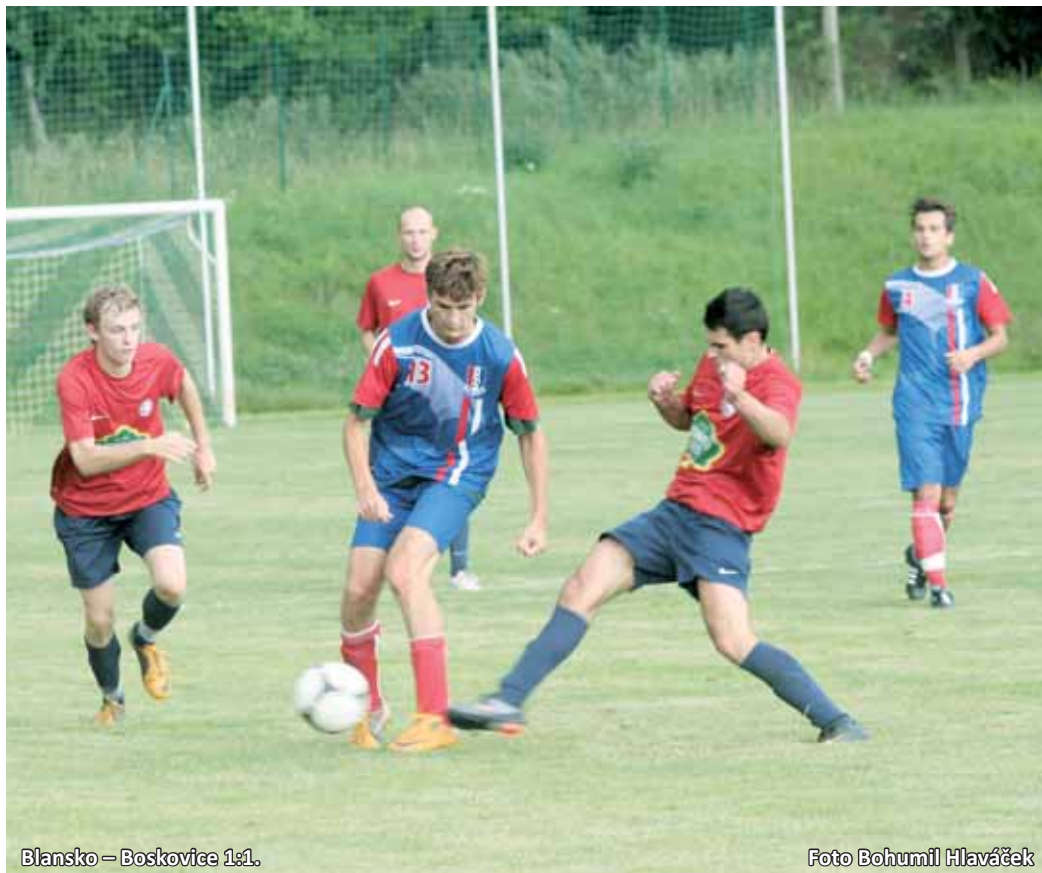
Blansko – Boskovice 1:1.