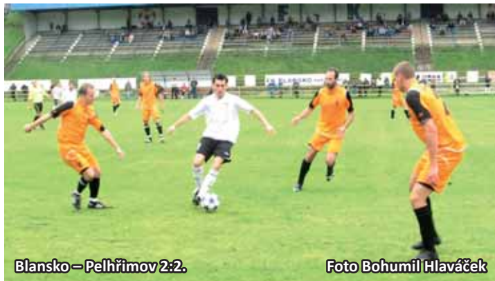
Blansko – Pelhřimov 2:2.