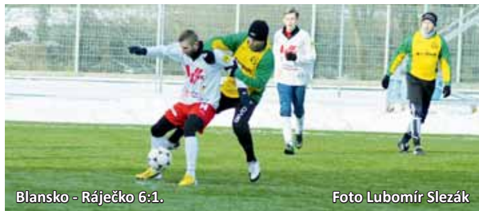
Blansko - Ráječko 6:1.

Blanensko a Boskovicko - Do zahájení jarní části krajských fotbalových soutěží sice zbývají ještě skoro dva měsíce (o mistrovské body se začíná bojovat 22. března), ale fotbalové celky z našeho okresu již hrají přípravná utkání.