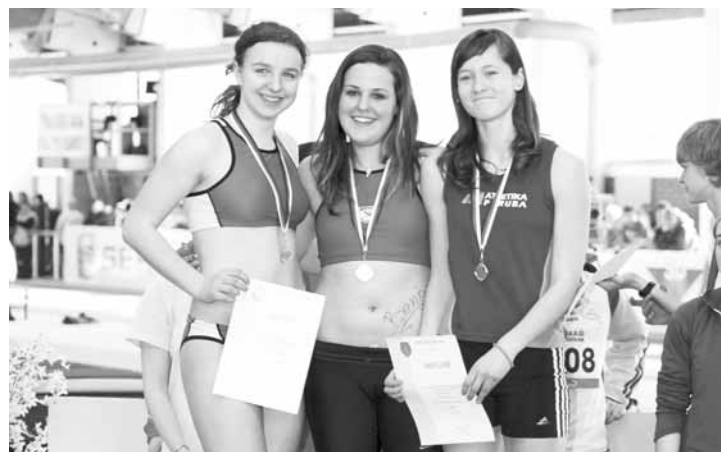
Medailistky z překážek.