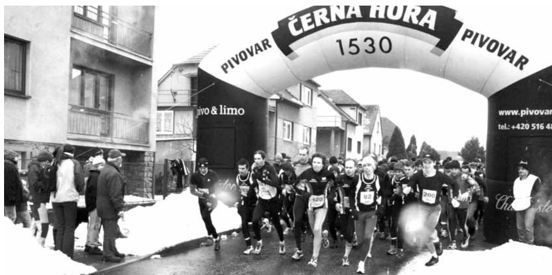
Start. V Ráječku se přes nepříznivé počasí objevilo početné pole závodníků.

„Bylo to pro mne dost náročné, kopce zrovna moc rád nemám,“