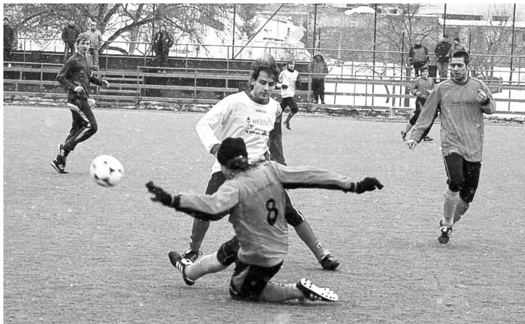
Boskovice - Březová nad Svitavou 2:3.