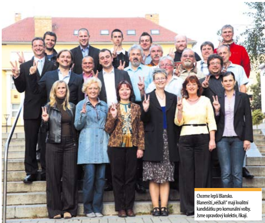
Chceme lepší Blansko. Blanensští „večkáři“ mají kvalitní kandidátku pro komunální volby. Jsme opravdový kolektiv, říkájí.