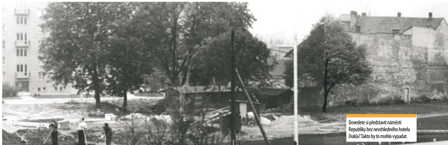
Dovedete si představit náměstí Republiky bez nevzhledného hotelu Dukla? Takto by to mohlo vypadat.