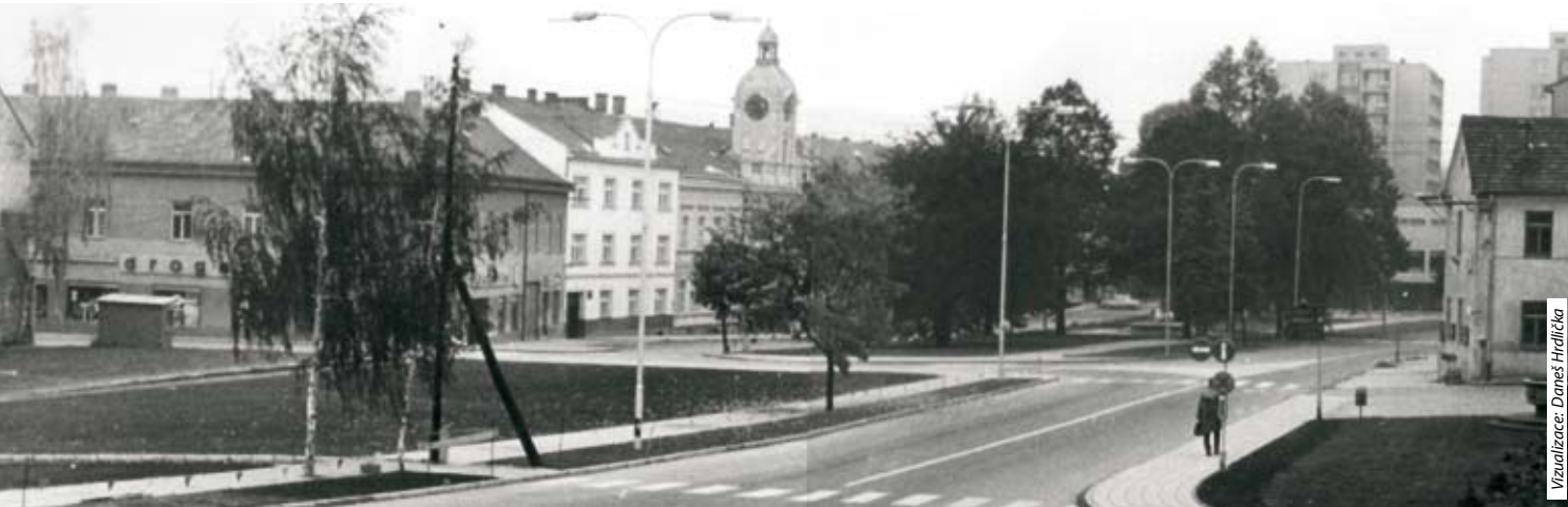
Visualizace: Današ Hrdlička