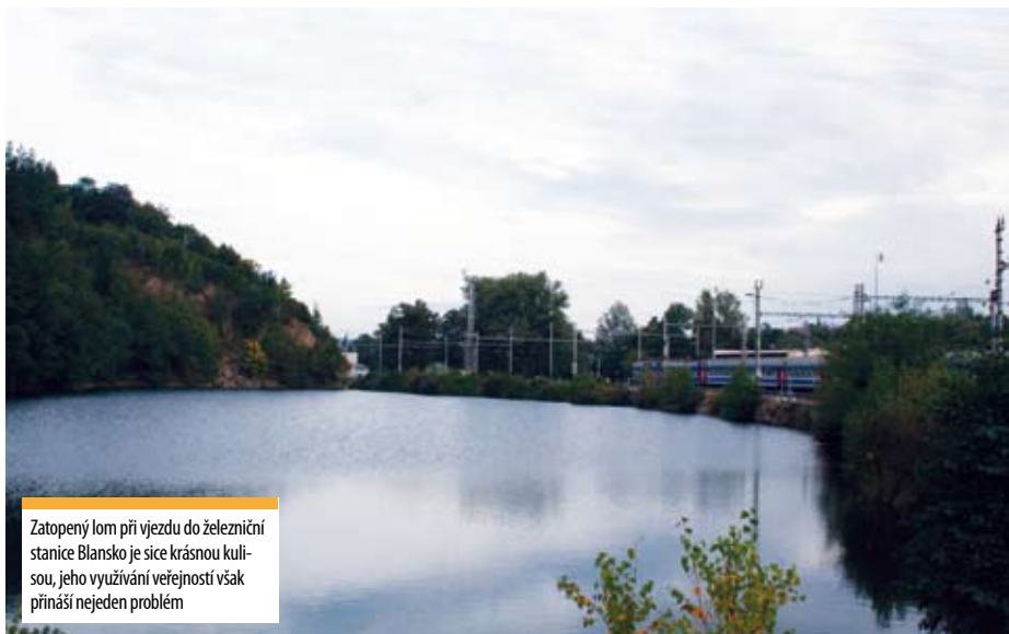
Zatopený lom při vjezdu do železniční stanice Blansko je sice krásnou kulíšou, jeho využívání veřejností však přináší nejjeden problém

Že autobusové a vlakové nádraží nepatří k „perlám“ města Blanska je dlouhodobě známý fakt. Město se přitom považuje za bránu do Moravského krasu. Věci veřejné se domnívají, že přestože tyto objekty nejsou v jeho vlastnictví, mělo by se intenzivněji zajímat o jejich funkčnost a vzhled.