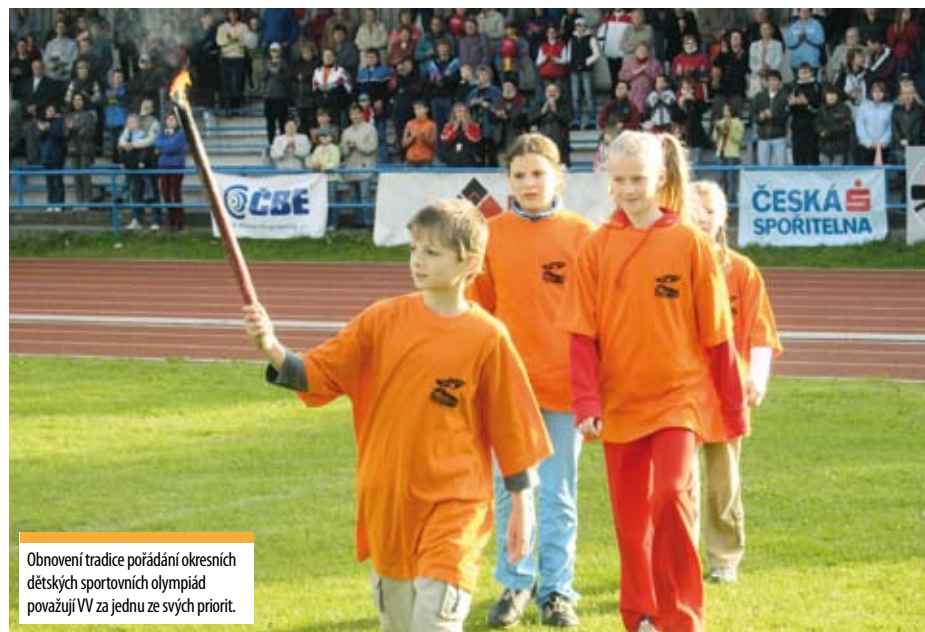
Obnovení tradice pořádání okresních dětských sportovních olympiád považují VV za jednu ze svých priorit.

Jedním ze stěžejních bodů volebního destera Věcí veřejných v městě Blansku, které všechny symbolicky začínají písmenem V, je trojka, kterou jsme nazvali Váš sport. Domníváme se totiž, že heslo, které představitelé radnice často používají Blansko – město sportu, se stalo tak trochu vyčichlým klišé. Proč?