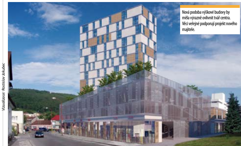
Nová podoba výškové budovy by měla výrazně ovlivnit tvář centra. Věci veřejné podporují projekt nového majitele.

Pro uskutečňování rozvoje žádoucím směrem je třeba, aby samosprávné orgány města rozhodly jen na základě odborných, pravdivých a komplexních informací, bez mimoregionálních lobbistických vlivů. Pak nebude nutné nadávat na vysokou zadluženost města, na neucelený nedokončený systém cyklostezek, na megalomanské ale jen sezónní investice (aquapark, zimní stadion), kompostárnu bez využití evropských dotací, problematické okružní křižovatky na hlavním dopravním tahu Blanskem, nedosta-